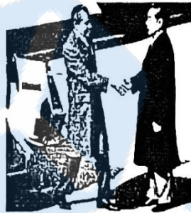
图2 周恩来迎接来访的美国总统尼克松

材料三 新中国成立 70 年来，尤其是 21 世纪以来，中国对稳定世界发展所作的贡献日益显著，中国的大国责任与担当快速增长，国际影响力日益增强。中国积极发展全球伙伴关系，扩大同各国的利益交汇点，构建人类命运共同体。—摘编自严文斌《解构百年大变局之“变”与“局”》